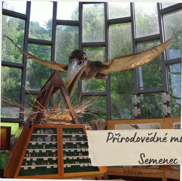
Přírodovědné muzeum Semeneč